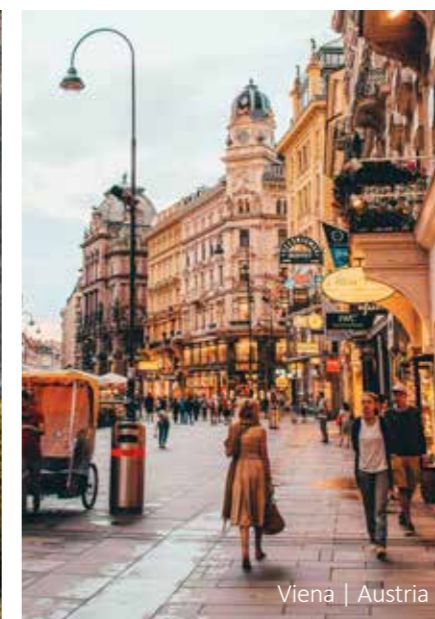
Viena | Austria