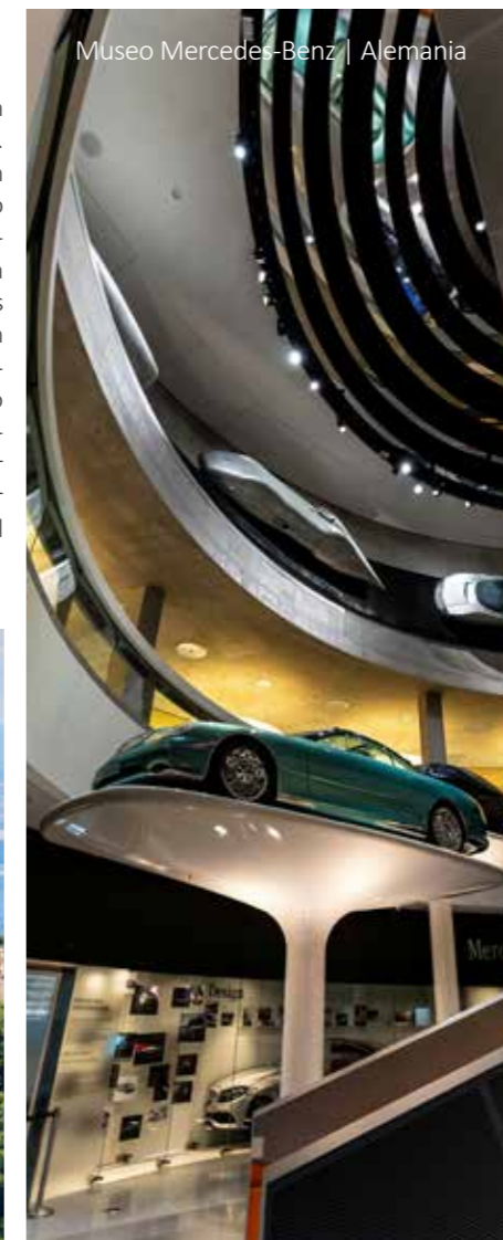
Museo Mercedes-Benz | Alemania

Stuttgart no es solo una de las ciudades más verdes de Alemania con un hermoso centro histórico, sino también sede de las famosas marcas Mercedes y Porsche. Después de una visita panorámica, visita del museo de Mercedes Benz. El tour finaliza en el Aeropuerto de Frankfurt alrededor de las 17:00 horas. Después parada en el hotel Mövenpick para los pasajeros con noches extras. Fin de nuestros servicios.