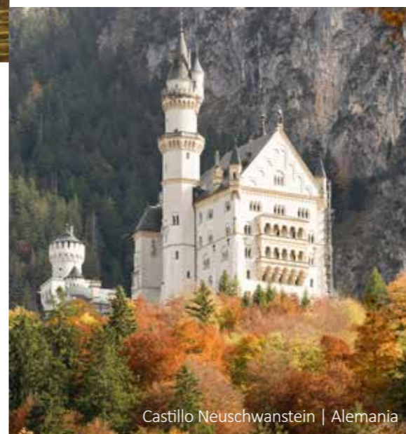
Castillo Neuschwanstein | Alemania

9 Viena Traslado privado al aeropuerto o estación de tren. Fin de nuestros servicios.