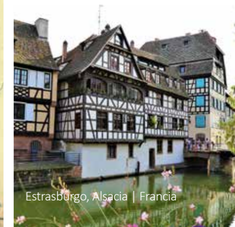
Estrasburgo, Alsacia | Francia