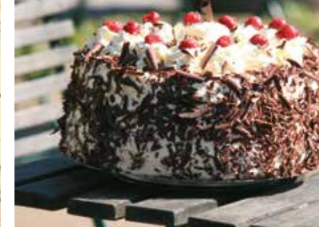
Pastel Selva Negra | Alemania

Salidas Garantizadas Viajes en Tren Escapadas Experiencias Únicas Viajes Clásicos (Viajes Privados) Viajes Culturales Fuera de los Caminos Trillados Viajes Culinarios Viajes en Familia Viajes Activos Tourismo Accesible Viajes de Lujo