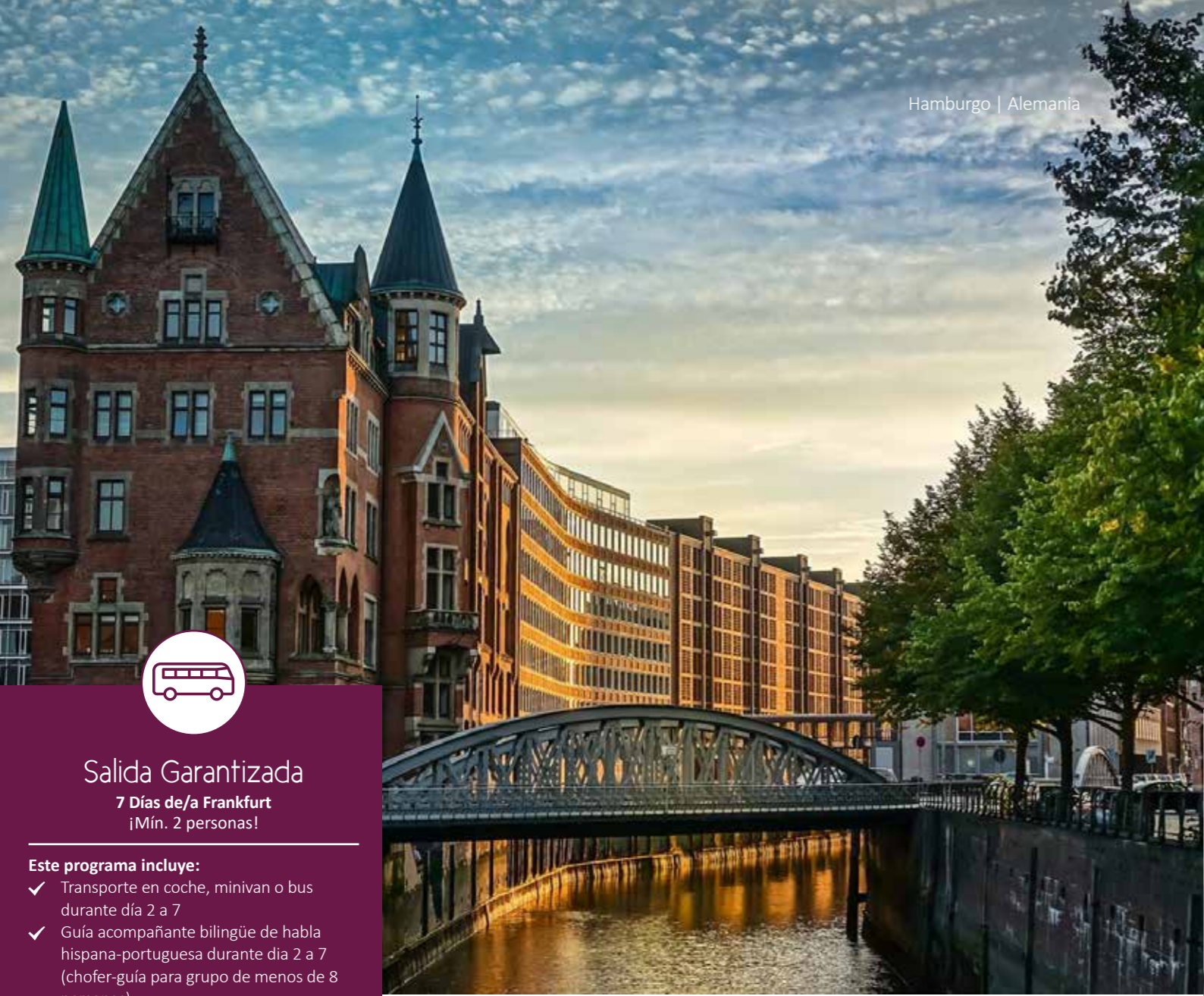
Hamburgo | Alemania