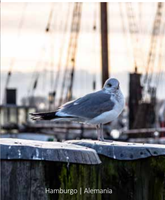
Hamburgo | Alemania

7 Erfurt - Frankfurt Después del desayuno tiempo libre para disfrutar la ciudad. Por la tarde llegada a Frankfurt. El tour finaliza en el Aeropuerto de Frankfurt alrededor de las 17:00 horas. Después parada en el hotel Mövenpick para los pasajeros con noches extras. Fin de nuestros servicios.