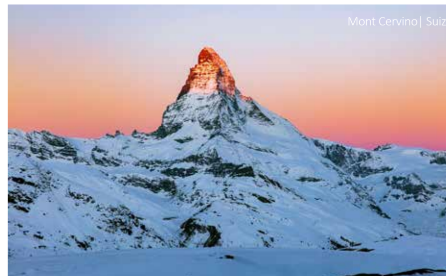
Mont Cervino | Suiza

Consultenos el precio para los traslados extras