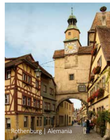
Rothenburg | Alemania

13 Varsovia Después del desayuno traslado al aeropuerto.