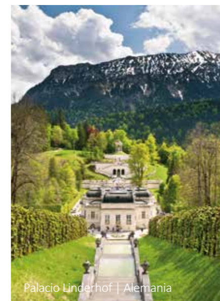
Palacio Linderhof | Alemania

Después del desayuno se hará una visita guiada de la ciudad. A continuación, salida hacia Frankfurt con una parada en la ciudad de Würzburg, que forma el límite norte de la "Ruta Romántica". Después de la visita a la ciudad de Würzburg continúa el viaje a Frankfurt. El tour finaliza en el Aeropuerto de Frankfurt alrededor de las 17:00 horas. Después parada en el hotel Mövenpick para los pasajeros con noches extras. Fin de nuestros servicios.