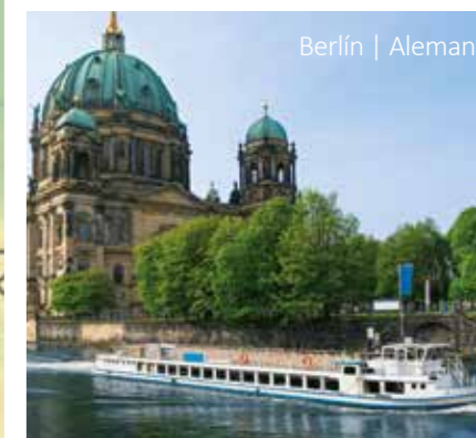
Berlín | Alemania

Salidas Garantizadas Viajes en Tren Escapadas Experiencias Únicas Viajes Clásicos (Viajes Privados) Viajes Culturales Fuera de los Caminos Trillados Viajes Culinarios Viajes en Familia Viajes Activos Turismo Accesible Viajes de Lujo