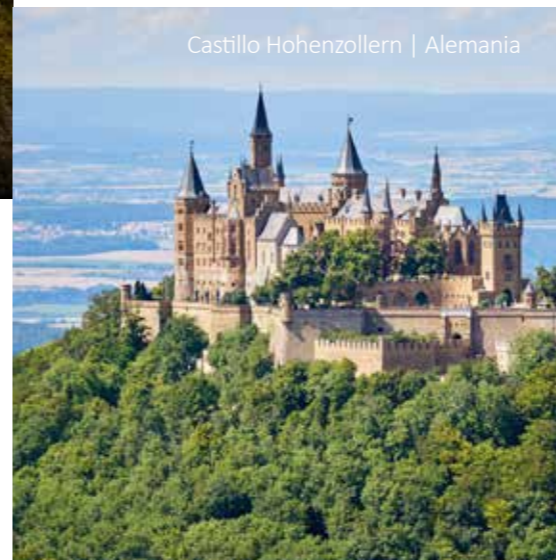
Castillo Hohenzollern | Alemania

Salida al Castillo de Hohenzollern que aún luce como si el tiempo no hubiese pasado. Situado en lo alto del monte Hohenzollern ofrece una vista casi tan espectacular como el propio diseño de la fortaleza. Continuación a través de la Ruta alta de la Selva Negra, una de las rutas turísticas más bellas de Alemania. Desde esta ruta se obtienen unas vistas preciosas del valle del Rin pasando por lugares espectaculares como el lago Mummel. En la tarde llegada a Baden-Baden donde tiene tiempo libre para disfrutar de los baños termales de la ciudad o probar su suerte en el casino. Alojamiento en el Holiday Inn Express Baden-Baden***.