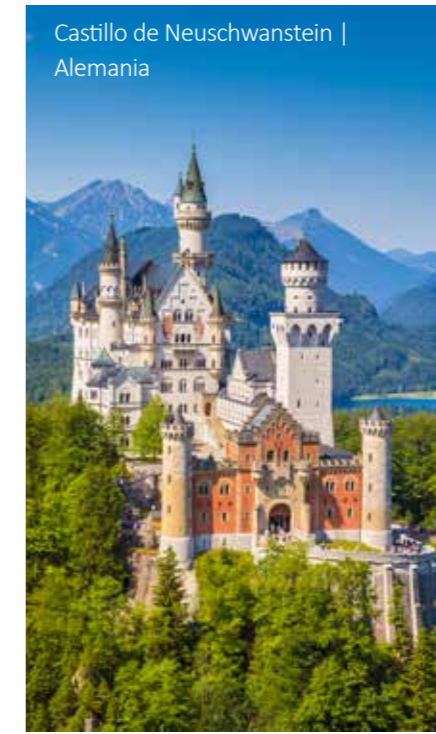
Castillo de Neuschwanstein | Alemania

10 Nuremberg - Würzburg - Frankfurt Después del desayuno se hará una visita guiada de la ciudad. A continuación, salida hacia Frankfurt con una parada en la ciudad de Würzburg, que forma el límite norte de la "Ruta Romántica". Después de la visita a la ciudad de Würzburg continúa el viaje a Frankfurt. El tour finaliza en el Aeropuerto de Frankfurt alrededor de las 17:00 horas. Después parada en el hotel Mövenpick para los pasajeros con noches extras. Fin de nuestros servicios.