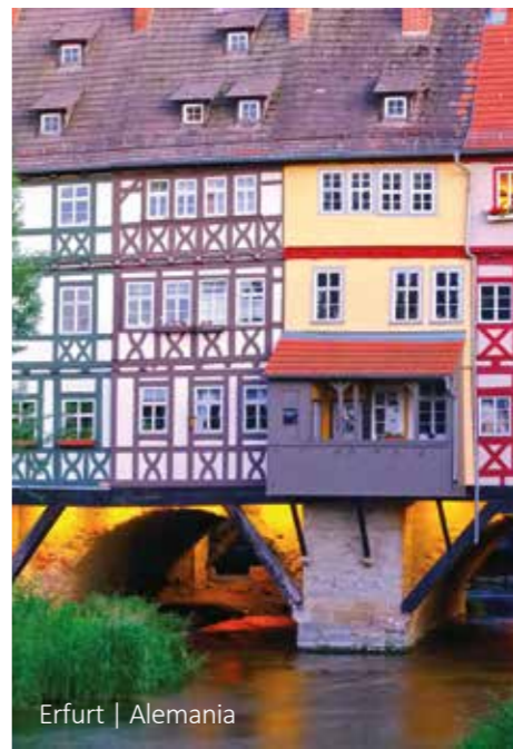
Erfurt | Alemania