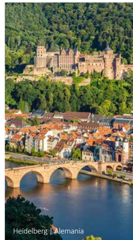
Heidelberg | Alemania

11 Zúrich Traslado del hotel al aeropuerto.