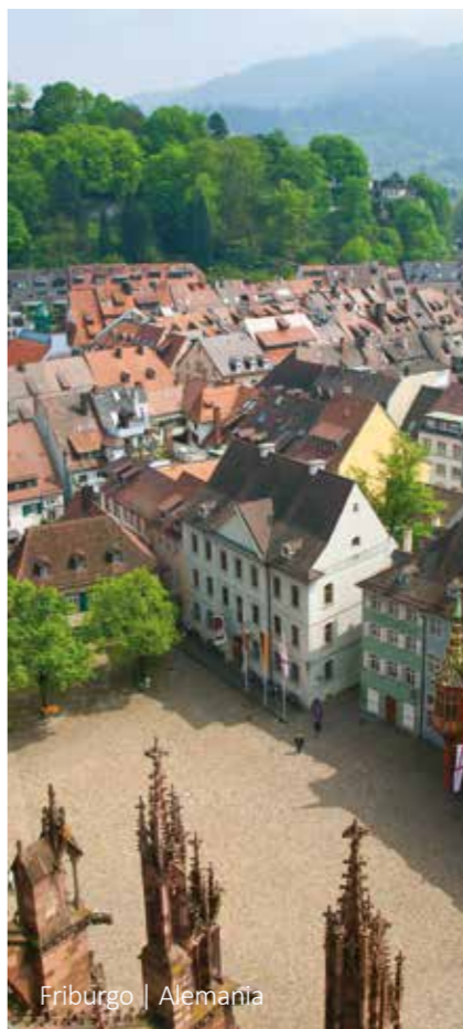
Friburgo | Alemania

9 Nuremberg - Würzburg - Frankfurt Después del desayuno se hará una visita guiada de la ciudad. A continuación, salida hacia Frankfurt con una parada en la ciudad de Würzburg, que forma el límite norte de la "Ruta Romántica". Después de la visita a la ciudad de Würzburg continúa el viaje a la ciudad de Frankfurt alrededor de las 17:00 horas. Después parada en el hotel Mövenpick para los pasajeros con noches extras. Fin de nuestros servicios.